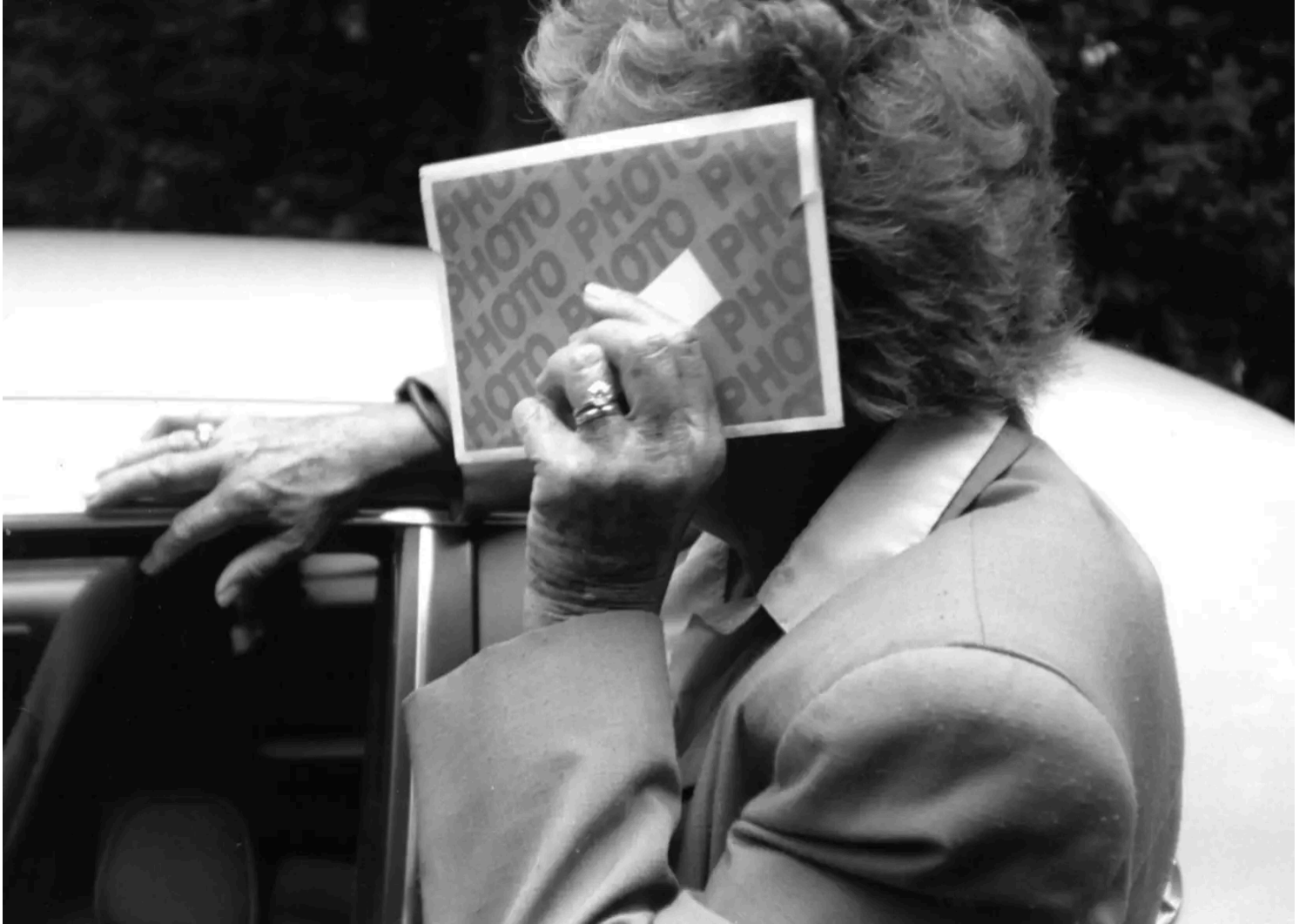
Cette expo intitulée «L'aveugle» évoquera l'aveuglement récurrent des êtres humains devant les problèmes du monde.